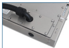
Uscita cavi per canalizzazione (IP65/IP66)