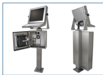
Configurazione a workstation completa con enclosure per PC, tastiera, staffa a forcella e piedistallo.