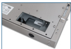
Accesso ai connettori interni