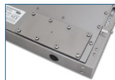
Piastra di copertura con foro pilota (IP65/IP66)