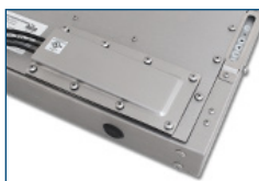
Premistoppa (IP22 o IP65/IP66)