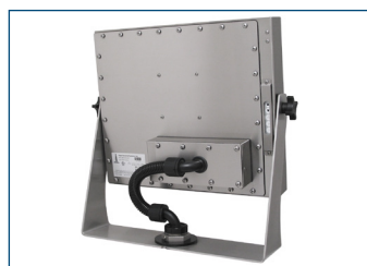
Monitor per montaggio universale montato su staffa a forcella industriale con prolunga KVM.