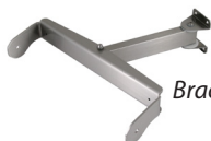
Braccio a estensione singola