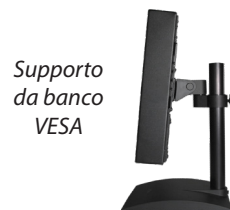
Supporto da banco VESA