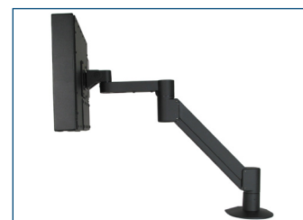
Monitor per montaggio universale montato su braccio radiale VESA.