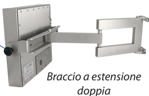
Braccio a estensione doppia

Le manopole di regolazione consentono di bloccare l'inclinazione del monitor