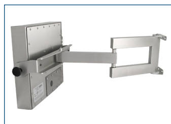
Monitor per montaggio universale montato su un braccio industriale per impieghi gravosi con grado di protezione IP65/IP66.