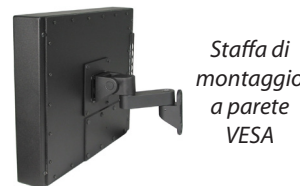
Staffa di montaggio a parete VESA